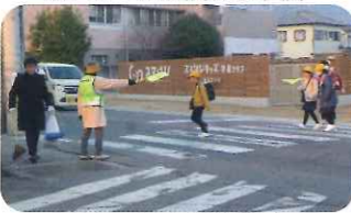
立哨(円座小学校近辺)