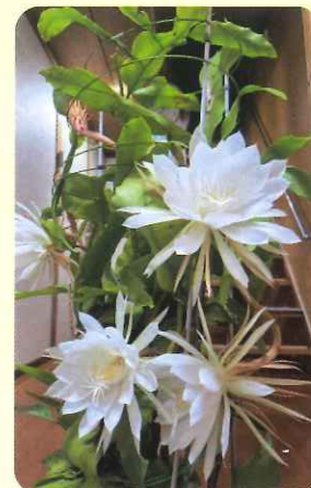
見事に咲いた月下美人