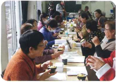
コミュニティセンター(クリスマス交流会)