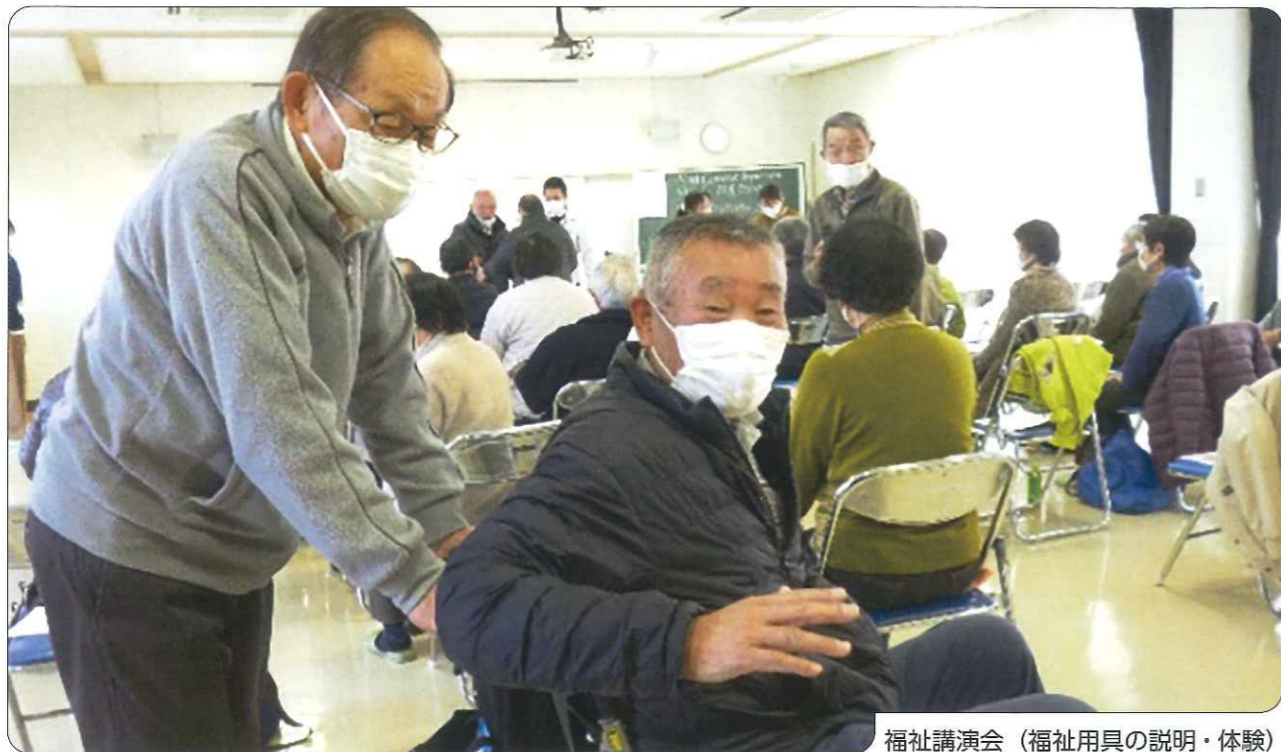
福祉講演会(福祉用具の説明・体験)