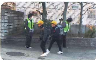
あいさつ運動(円座小学校)

子ども達の安全に気を配りながら見守っています。子ども達の笑顔に元気をもらっています。