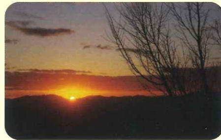
堂山からのご来迎

円座地区の皆さんが自由に参加し、楽しんでいただくコーナーです。日頃何気なく眺めている風景・ペット・お花などの身近な写真を円座コミュニティセンターまでお寄せください。 eメール 可 (メールアドレスshakaifukushi4993enza@outlook.com)